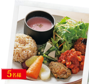
5名様 ベジモ野菜食堂 2,000円分の食事券