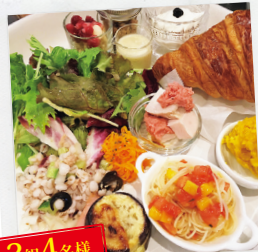
2組4名様 SHEBA CAFE ブランチプレートペア招待券

朝食が自慢の新ホテル宿泊券をはじめ、身体想いなグルメを楽しめるプレゼントを用意しました! ※写真はイメージです。