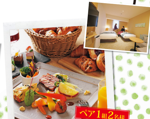
ペア1組2名様 ホテルインターゲート広島 ペア宿泊券(朝食付)