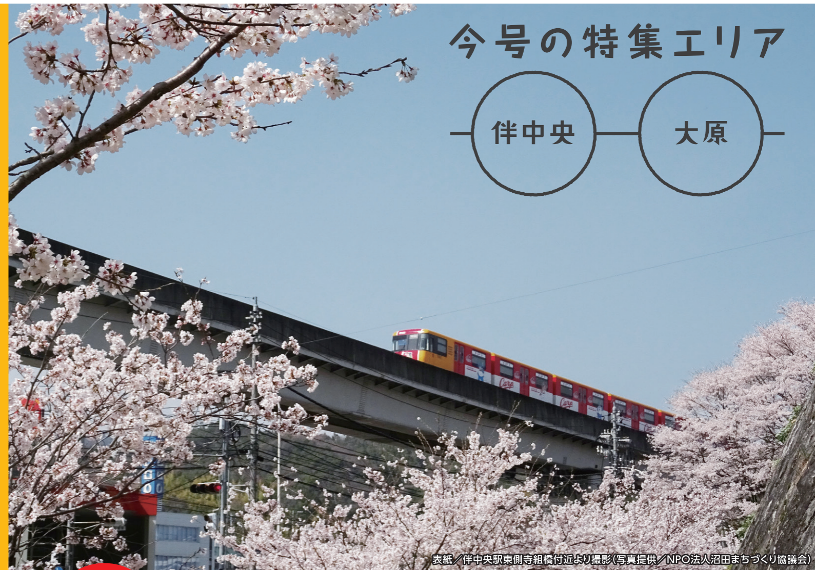
表紙 / 伴中央駅東側寺組橋付近より撮影