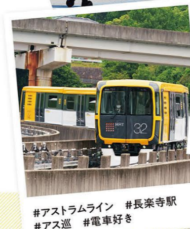
#アストラムライン #長楽寺駅 #アス巡 #電車好き