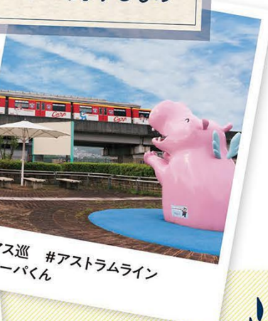
#アス巡 #アストラムライン #カーバくん