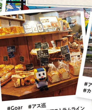
#Goar #アス巡 #パン屋めぐり #アストラムライン