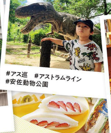
#アス巡 #アストラムライン #安佐動物公園