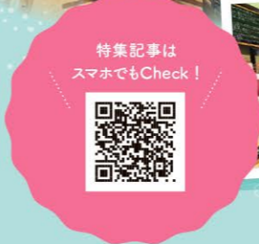
特集記事はスマホでもCheck!