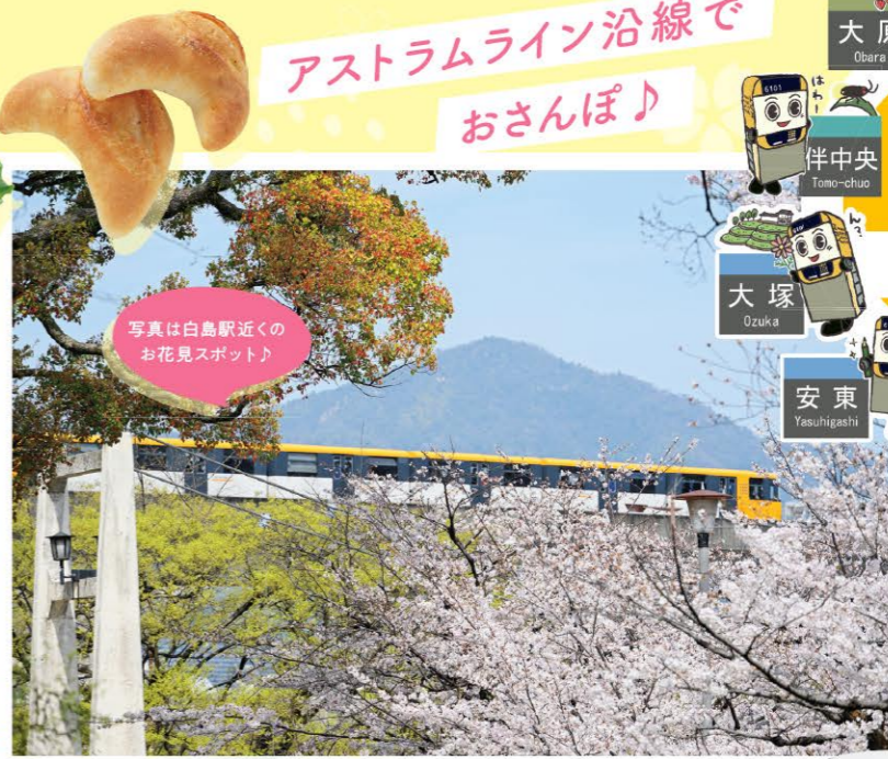
写真は白鳥駅近くのお花見スポット！