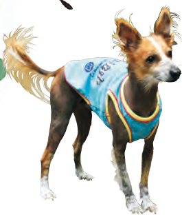
チャイニーズ・クレストドッグの看板犬、ジジ。