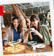
芸北ぞうさんカフェ 2,000円分のお食事券

大自然に包まれながら心を開放できる魅力的なスポットで癒しのひとときを。 ※写真はイメージです。