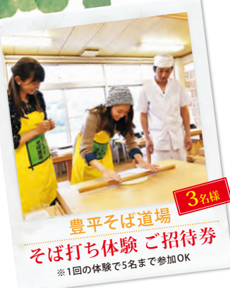
豊平そば道場 そば打ち体験 ご招待券 ※1回の体験で5名まで参加OK