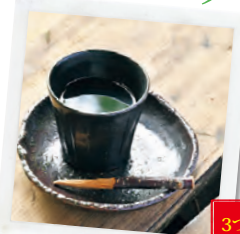
正直村 アフタードリンク券