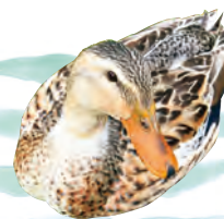
愛らしく泳いだり歩いたりするカモには、エサやりもできる。