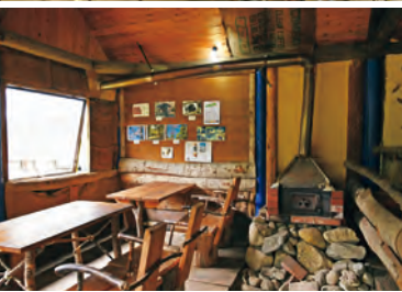
(上)人懐っこい看板犬・ゴボと羊のミーゴが出迎えてくれる。 (下)ウェディングパーティーなど、幅広く利用できるスポット。ポーランド食器の販売もあり。