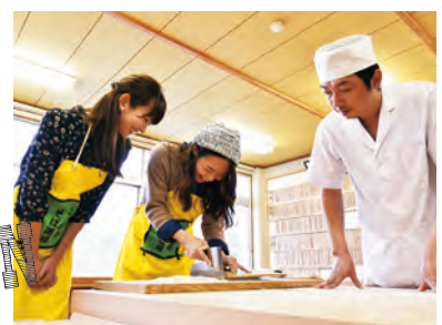
自分で打ったそばの味は格別だ。そば打ち体験5人前 3,400円(試食は1人+220円)。*予約優先

宿泊施設や温泉、そば処を兼ね備えたこちらで体験できるのが、初心者でもOKのそば打ち。コツをつかめばどんどん面白くなるそば打ちの魅力に触れてみよう。家族や友人の少人数から、団体での利用(最大50名)までOK。