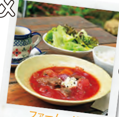
ファーム・ノラ 2,000円分のお食事券