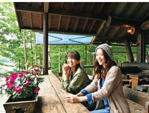
湖を眺めながらゆっくりくつろげるテラス席。煮込みハンバーグやビーフシチューなどの食事もあり。