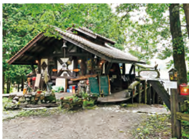
オープンして来年で20年。大人の隠れ家として愛され続けている店だ。