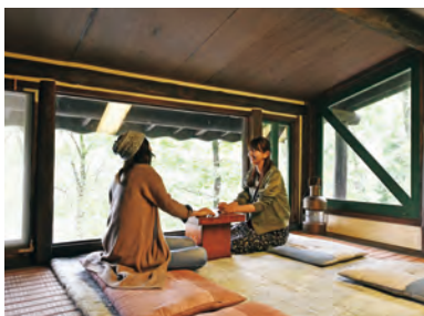
朝食付き宿泊施設のB&Bもあり、1名9,000円〜利用できる。 ※予約はネットのみ