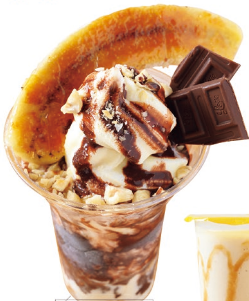
ショコラバナナパフェ 980円 仕上げにキャラメリゼしたバナナをトッピングしたバナナ尽くしのパフェ。