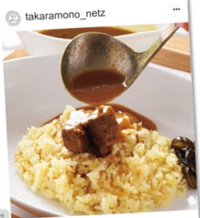
takaramono_netz オリジナルビーフ煮込みカレー990円 #ごろっと大きな牛肉入り #広島カレー店 #カフェ使いもOK