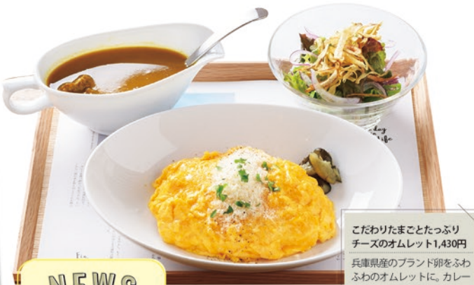
こだわりのまことたっぷりチーズのオムレット1,430円 兵庫県産のブランド卵をふわふわのオムレットに。カレーとの相性は言わずもがな!